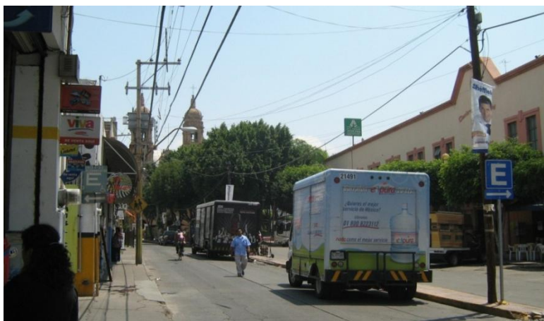
Calle 27 de septiembre frente al mercado